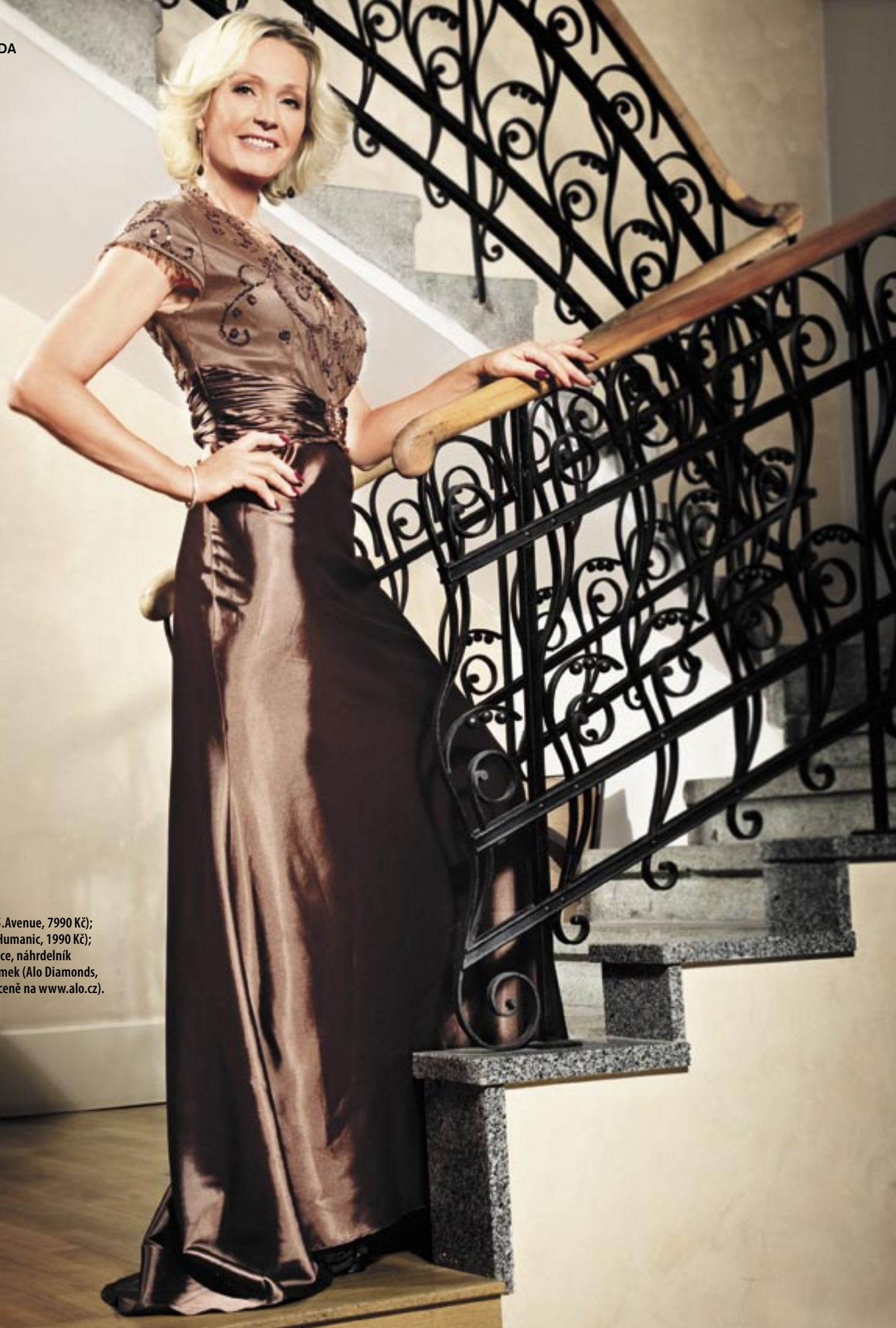
Šaty (5.Avenue, 7990 Kč); boty (Humanic, 1990 Kč); náušnice, náhrdelník a náramek (Alo Diamonds, info o ceně na www.alo.cz ).